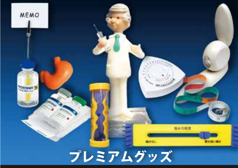
プレミアムグッズ