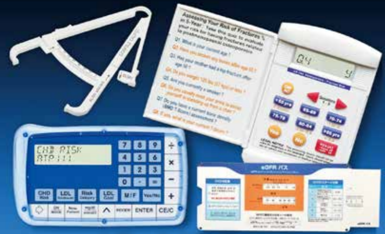
メディカル計算ツール