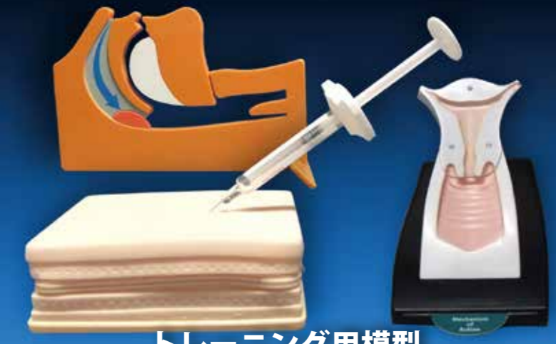
トレーニング用模型

オリジナル模型や、患者説明ツールを通して、貴社商品の新しい市場の開拓と、商品認知度の向上をアプライが心よりお手伝いさせていただきます。